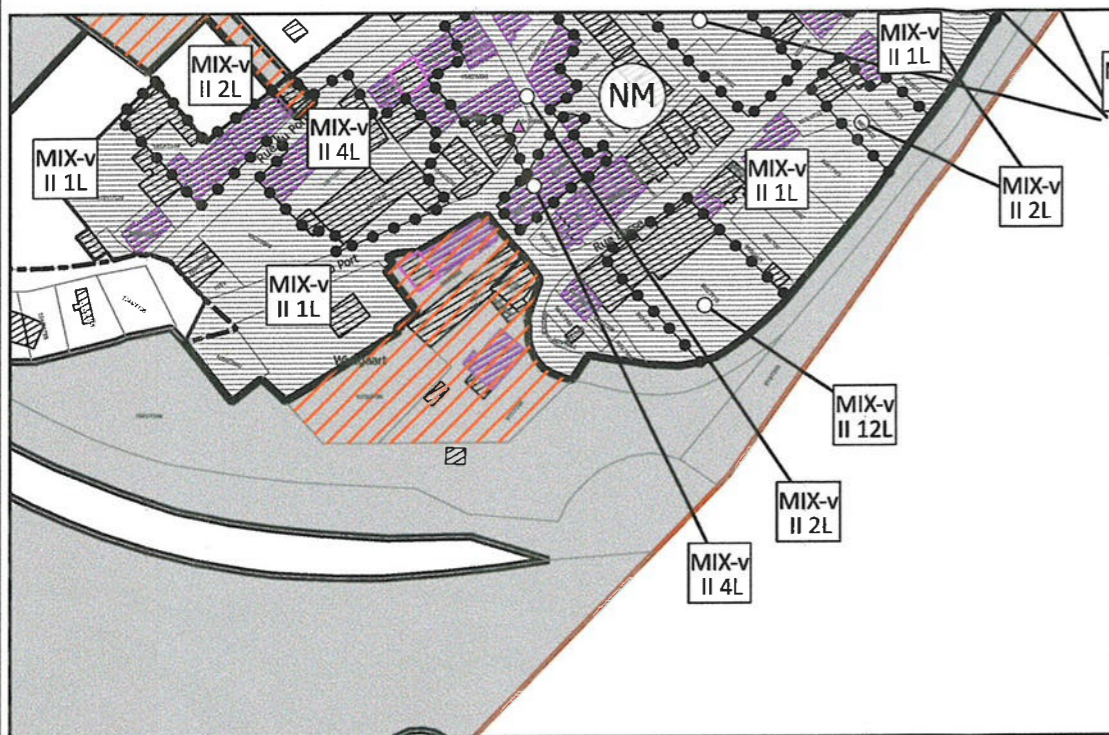
Plan de repérage - en vigueur