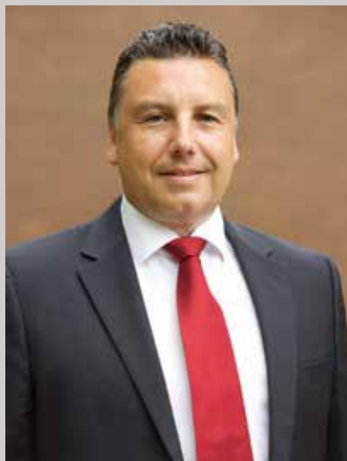
Ihr Bürgermeister / Votre Bourgmestre

Il sera probablement inévitable que la réalisation des projets entraîne temporairement des changements dans la vie quotidienne. Dans ce cas, nous nous tiendrons à la disposition des citoyennes et des citoyens de la commune pour récolter toutes les suggestions et critiques constructives généralement quelconques.